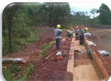
Limpeza de vala