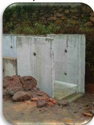
Aduela pré-moldada de concreto