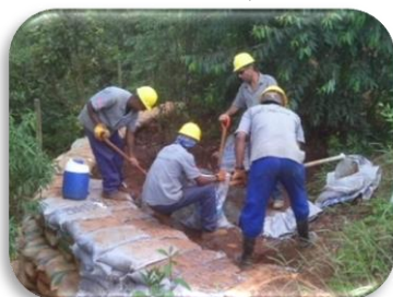
Contenção de talude com Rip Rap