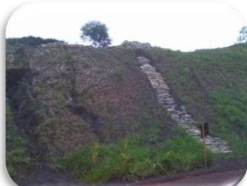
Recuperação de erosões em talude