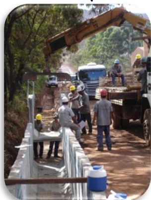
Assentamento de aduelas