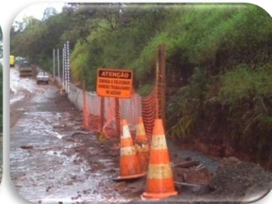
Sinalização da Obra