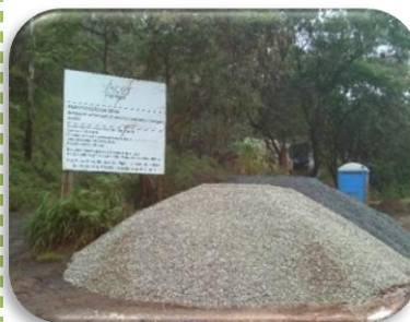
Identificação da Obra